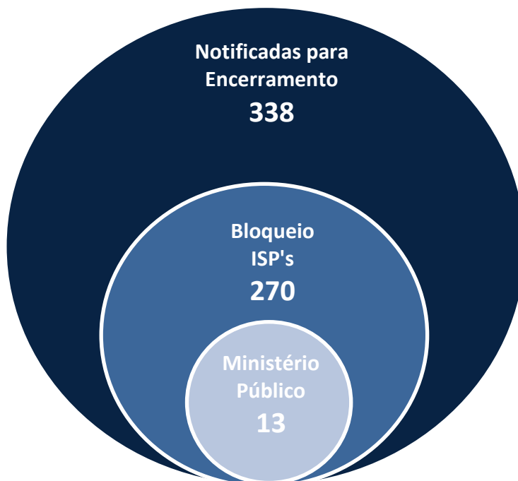
Fig. 17| Operadores de Jogo Online Ilegais

No total foram efetuadas 13 participações junto do Ministério Público para efeitos de instauração dos correspondentes processos-crime.